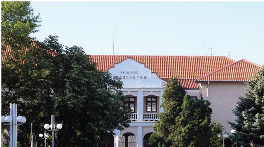
Читалище "Постоянство", гр. Лом - 1856 г.